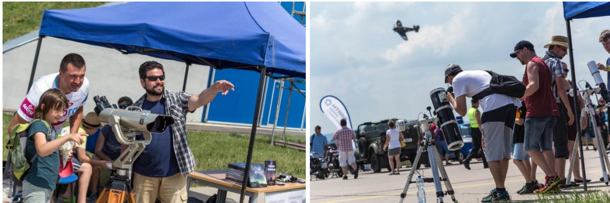
Astronomický stánek na 28. Aviatické pouti v Pardubicích 2. a 3. června 2018.