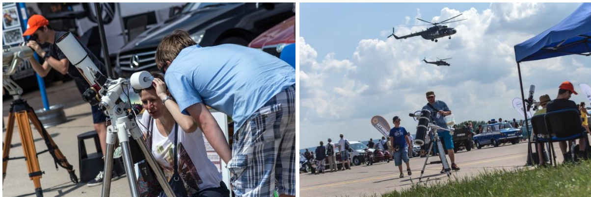
Astronomický stánek na 28. Aviatické pouti v Pardubicích 2. a 3. června 2018.