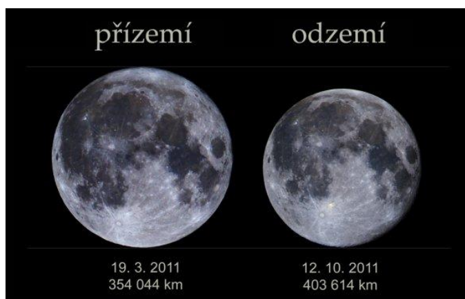
Úplněk v přízemí a odzemí v roce 2011. Autor: Martin Gembeč.

Úplněk připadá 14. listopadu na 14:52 SEČ. Asi dvě hodiny poté, před 17. hodinou vyjde u nás Měsíc nad severovýchodní obzor. Nejvýše na obloze bude až krátce po půlnoci, kdy bude nad jihem v souhvězdí Býka. Nejvíce nás upoutá svým vysokým jasem (superúplněk je asi o 30 % jasnější, než když je Měsíc v "mikroúplňku"). Naopak toho, že je trochu větší, si okem nevšimneme a jde to poznat jen porovnáním s jinými úplňky na fotografii (viz porovnání největšího a nejmenšího úplňku roku 2011).